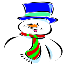
Tableau d'honneur :

Le chemin des écoliers http://marcfavreau.csdm.ca